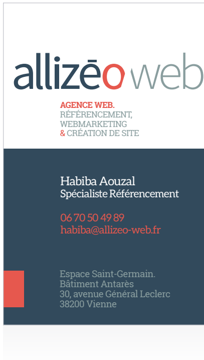
CARTE DE VISITE RECTO VERSO